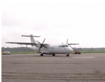
oder : Flug ab Palanga