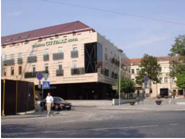
Vilnius Hotel Amberton

Kaunas Kathedrale Garnisonkirche Rathaus Kleines Mittagessen Restaurant „Medziouga“, dann weiter nach Vilnius Einchecken Hotel „Amberton“ Stadtrundgang Innenstadt Vilnius Abendessen Hotelrestaurant „de Antonio“ Übernachtung Hotel**** „Amberton“