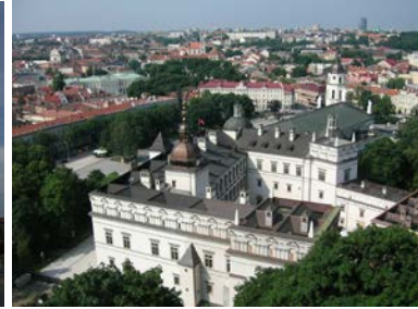
Blick ueber Vilnius

5.Tag Stadtrundgang Vilnius, Universitaet, Gotisches Ensemble, „Madonna von Wilna“