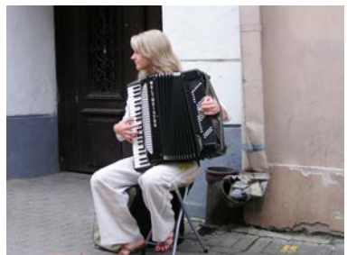
Vilnius ist Musik

Nachmittags Ausflug zur Wasserburg Trakai, Karaerermuseum, Biruteburg Abendessen Restaurant “Bunte Gans” Übernachtung Hotel **** „Amberton“