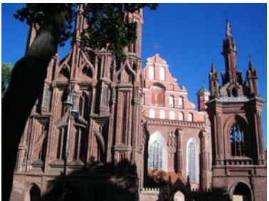
Vilnius Gotisches Ensemble

5.Tag Stadtrundgang Vilnius, Universitaet, Gotisches Ensemble, „Madonna von Wilna“