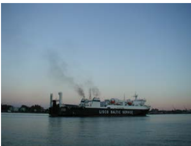
Faehre nach Kiel