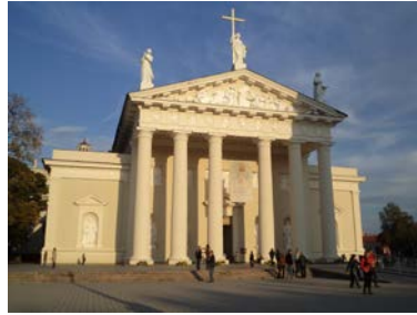
Kathedrale St. Stanislaus