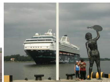
Good bye Lithuania