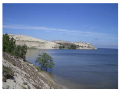
Eindrucksvolle Kurische Nehrung