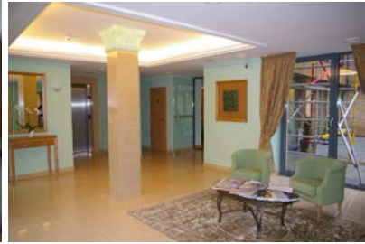
Unterkunftsbeispiel Hotel Euterpe, Klaipeda

Kleiner Mittagsimbiß, Restaurant Max Haemmerli Anschließend Rundgang Altstadt Klaipeda mit Freizeit Gemeinsames Abendessen Hotelrestaurant Übernachtung Hotel **** „Euterpe“